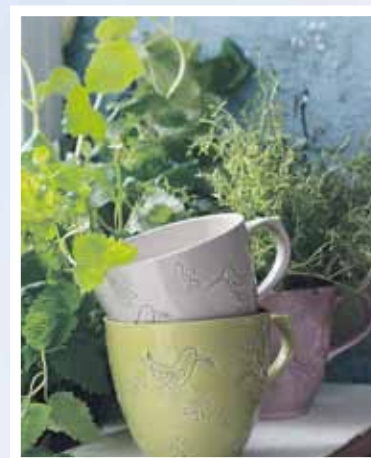
Café & Shopin valikoimista löytyy myös oman keramiikkapajan tuotantoa.

"Eihän vanha talo koskaan valmiiksi tule, aina on laittamista."