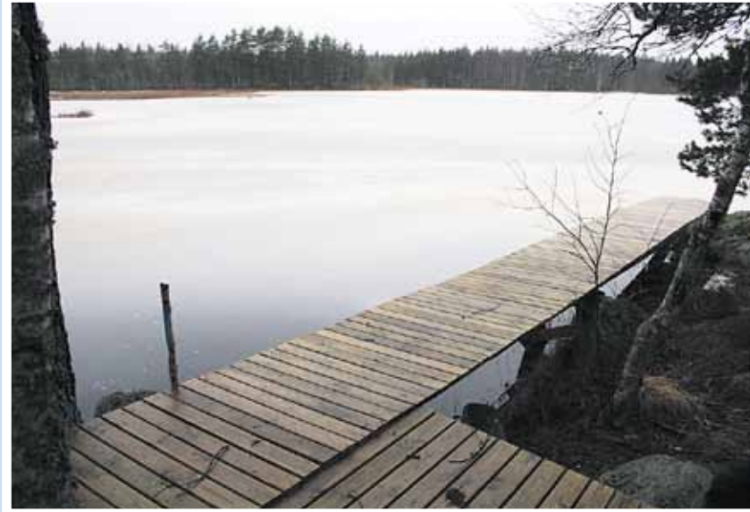
Sarvijärvelle rakentui laituri talkootyönä.

"Saunan ovet ovat aina auki, joten sitä voi käyttää kuka vain."