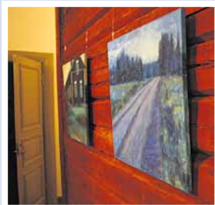
Yläkerrassa voi pysähtyä taiteen äärelle.

– Keskikuisti jäi vielä siivoamatta, joten se menee ensi kesälle. Mitään suurta siellä ei tehdä, vaan varovasti uusitaan pintoja. Myös pihan valaistusta parannetaan, ja viimeistelytöitä on vielä tekevä. Eihän tällainen talo koskaan valmiiksi tule, aina on laittamista, Taimisto hymyilee.