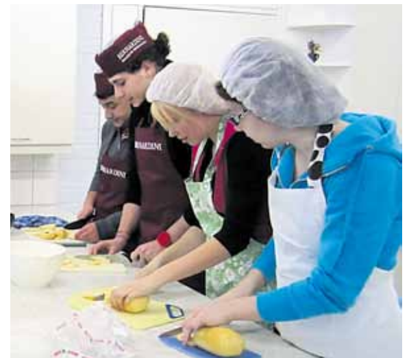
Yhtenä iltana kokkailtiin italialaiseen ja suomalaiseen tapaan. Kuvassa valmistetaan taikinaa lasagnelevyjä varten.

Huhtikuussa Italiaan lähdeettäessä erityisesti nuorille isännät olivat jo vanhoja tuttuja, sillä välimatkasta huolimatta yhteyksiä oli pidetty etenkin Facebookin välityksellä. Hanke ei jäänyt ainoastaan henkiseksi pääomaksi nuorille, vaan hankkeen tiimoilta toteutettiin myös suomalais-italialainen reseptivihkonen, videolevy ja kuvakirja. ♦