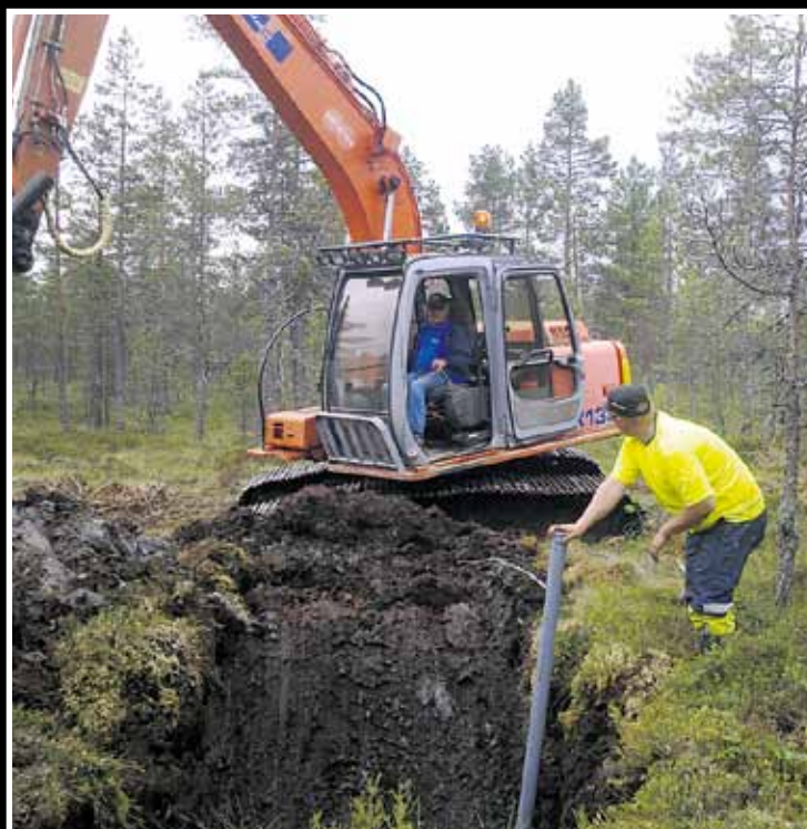
Syksyllä Botniaringin laajennusalueille asennettiin pohjaveden mittauspisteet.

Kehittämistyötä vauhdittaa Suupohjan Kehittämisyhdistyksen rahoittama hanke.