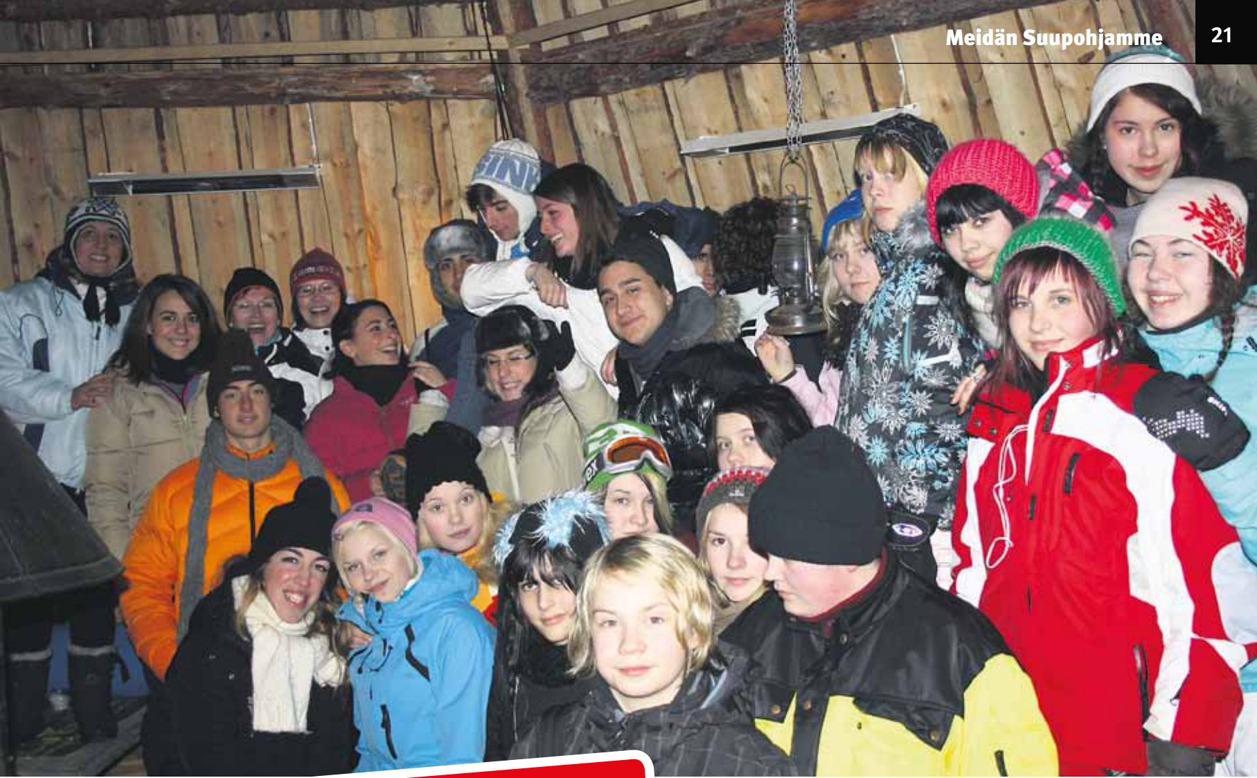
Mamma Mia! Viimeisenä iltana kokoonnuttiin Parran kodalle nauttimaan loimulohesta ja nokipannukahveista.