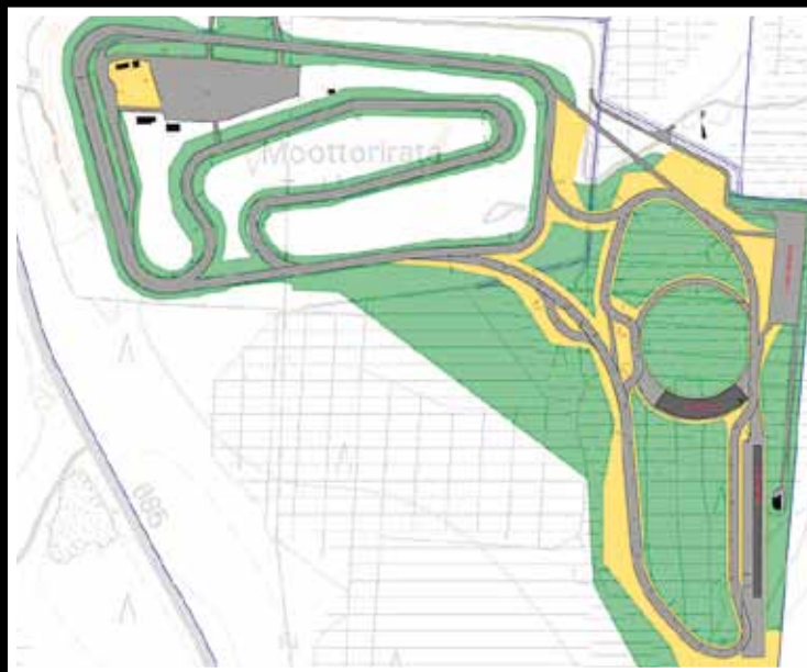
1. vaiheessa valmistuva rataosuus.