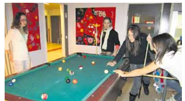
Yhteistä vapaa-aikaa vietettiin vieraiden kanssa myös leppoisasti biljardia pelaillen.